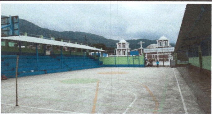
Foto No. 3 Cancha polideportiva ya fundida.