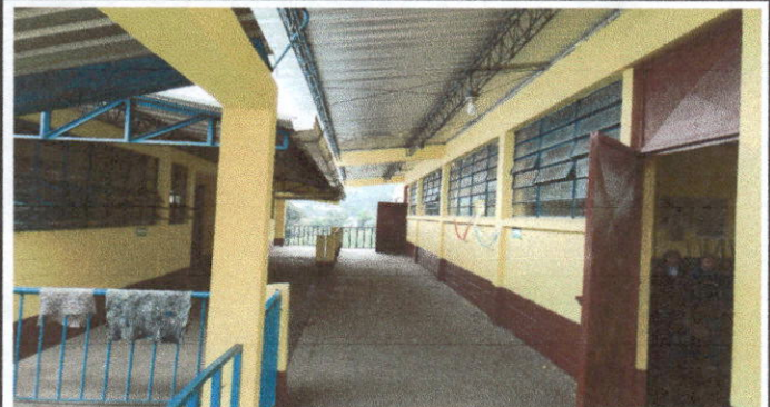
Foto No. 2 Cambio de techo de dos aulas finalizado.