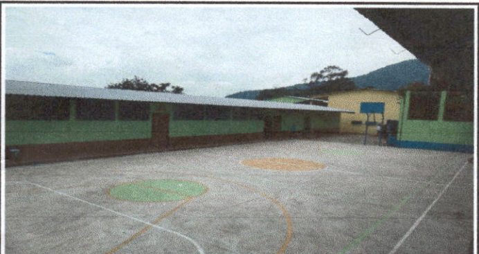
Foto No. 4 Cancha polideportiva ya finalizada.