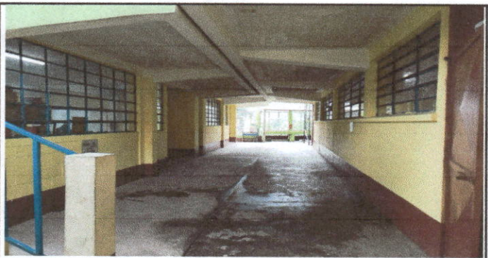
Foto No. 6 Proyecto de pintado exterior e interior ya finalizado.

Observación: Si es necesario se pueden agregar hojas adicionales y actualizar el número de hojas.