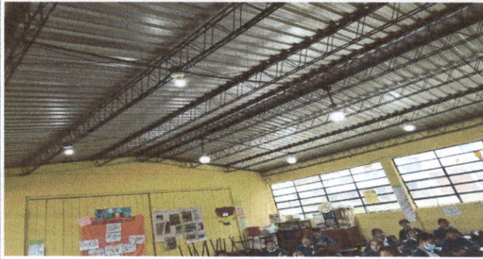
Foto No. 1 Cambio de techo de dos aulas finalizado.